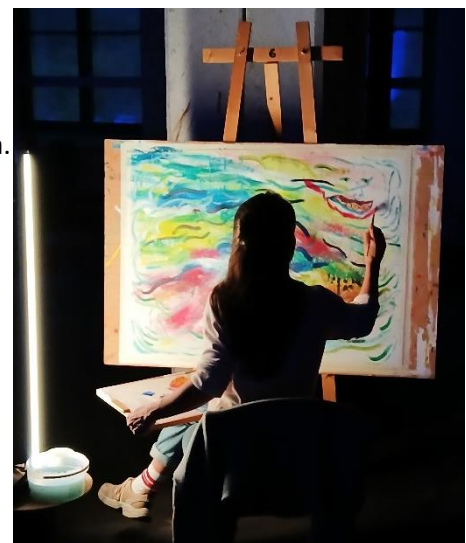
En deltagare i livemåleri workshopen under BRUK 2025.

I förstudien ingick att bygga ut nätverken och binda ihop kulturöar. Samarbetet med Levande Musik från Göteborg inleddes 2024 och fortsatte 2025! Det mycket lyckade samarbetet med Kulturförvaltningen VGR's artistresidens som inleddes 2021 och fortsatte med den nordiska kvartetten "JÓR Saxophone Quartet 2024 och Emiliano Sacripanti 2025.