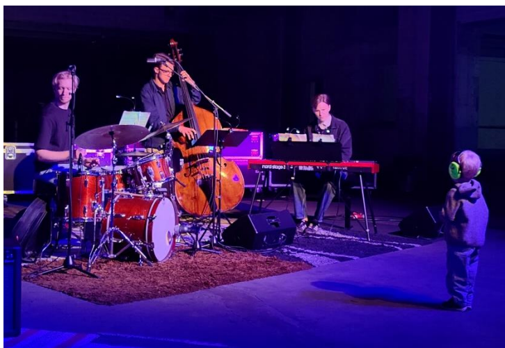
Fin interaktion mellan ung publik och Felicità Brusoni /Halvordsson, Boqvist, Kling trio på BRUK 2025.