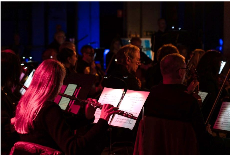
Östfold symfoniorkester från BRUK 2025.

BRUK är ett genre- och konstartsövergripande koncept som vill omforma konsert- och kulturbegreppet. Vi vill visa att man utanför institutionerna kan skapa musik- konst- och kulturevenemang på ett annat sätt, bort från gängse normer och konventioner. Med BRUK vill vi skapa små världar och "upplevelseöar" att kliva in i och som dessutom förändras inför varje år. BRUK bjuder in och välkomnar alla. Vi strävar efter spontan och ömsesidig interaktion mellan publik och artister och har genom vårt prestigelösa förhållningssätt lyckats nå en mångfacetterad publik som växer inför varje år. Vi är övertygade om att i tider där kultur ifrågasätts är det nödvändigt att tänka nytt och göra musik, konst och kultur viktigare för fler människor.