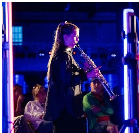
JÓR Saxophone Quartet från BRUK 2024